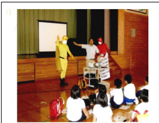
交通安全とゲロッピー