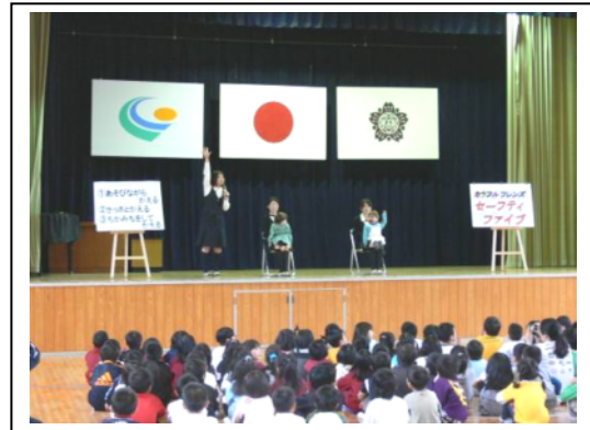
つれさり防止教室